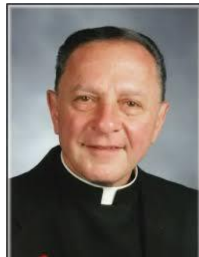
October 22, 1944 - April 15, 2024